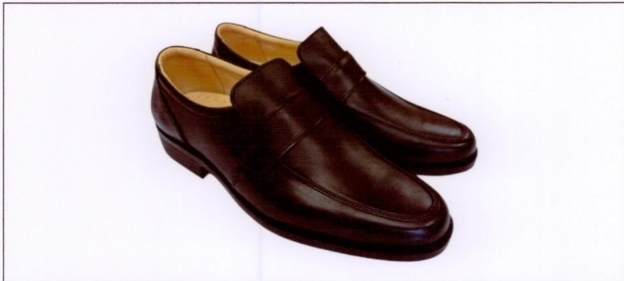
Giày da thường phục