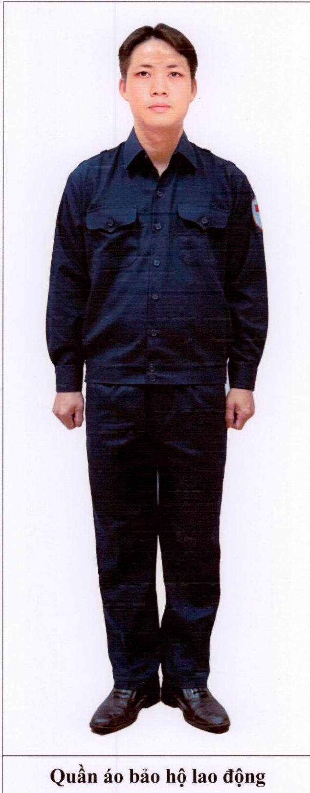
Quần áo bảo hộ lao động