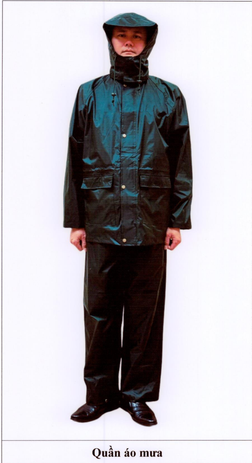
Quần áo mưa