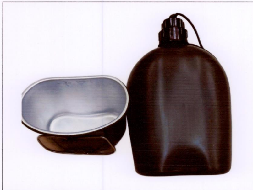
Bi-đông 1 lít + ca