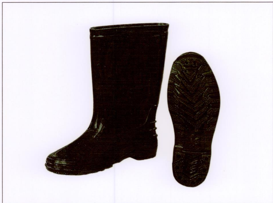
Ủng cao su