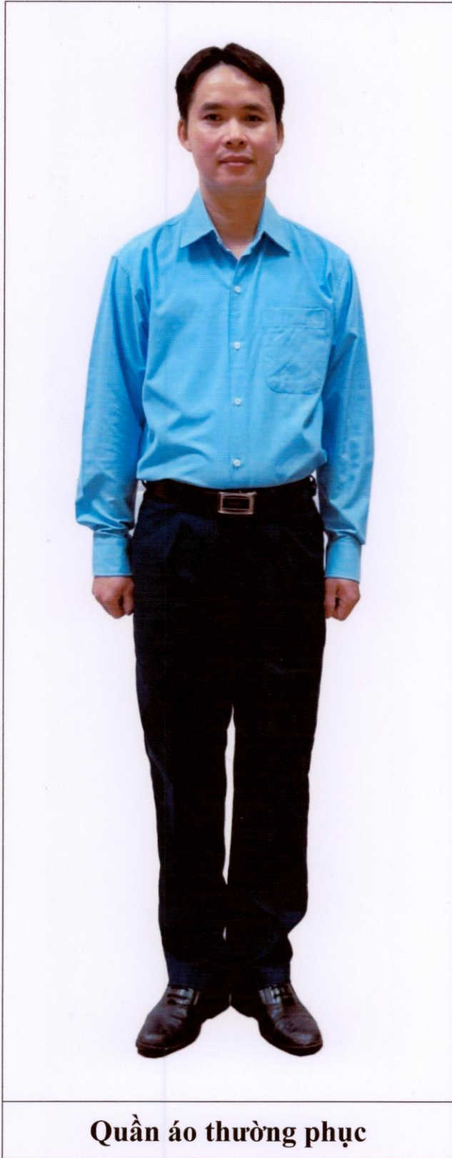
Quần áo thường phục