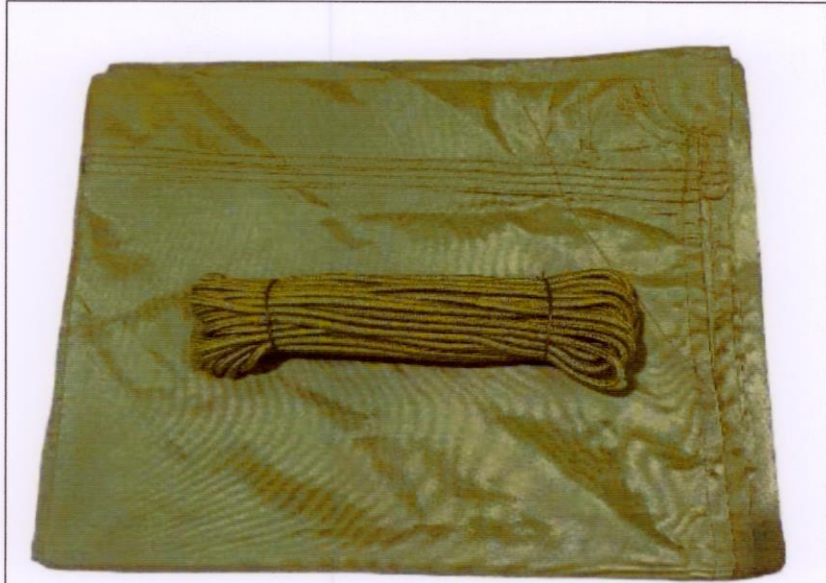
Võng KapoRông + dây