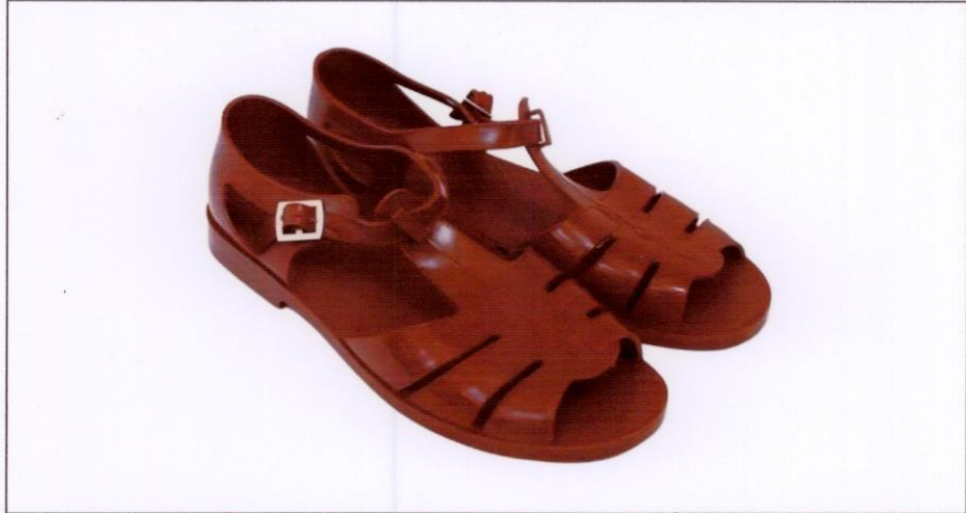
Dép nhựa (Dép lê nhựa)